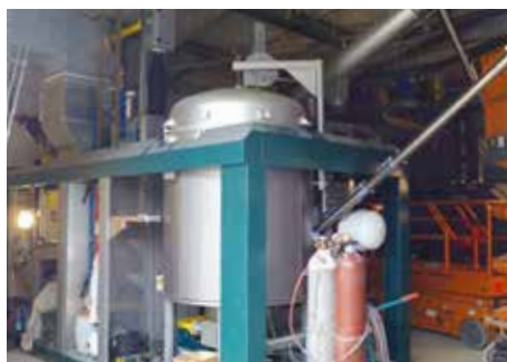
Pelletvergaser im Inneren